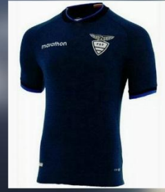
OPCIÓN # 6