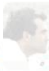
DT. Santiago de la Torre