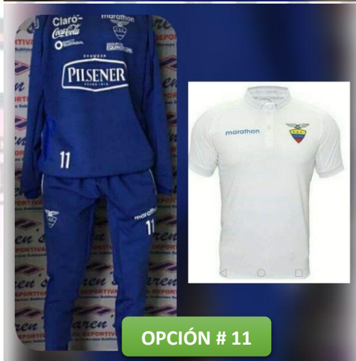
OPCIÓN # 11