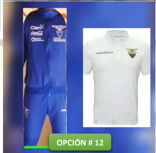
OPCIÓN # 12