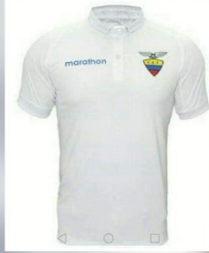
OPCIÓN # 5