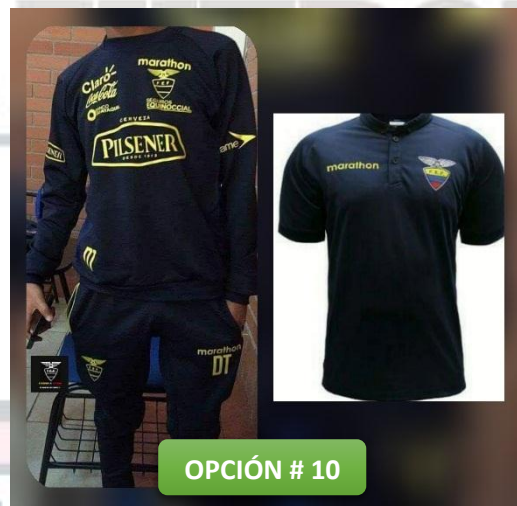
OPCIÓN # 10