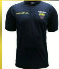
OPCIÓN # 7