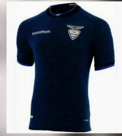
OPCIÓN # 8